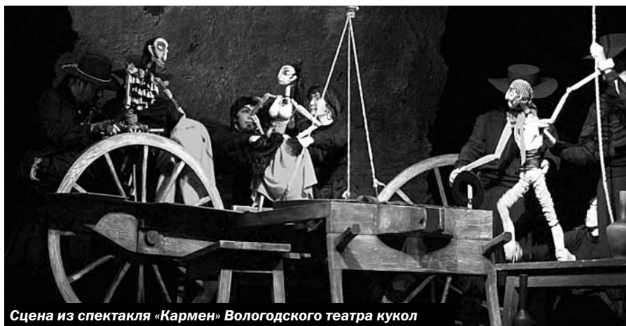
Сцена из спектакля «Кармен» Вологодского театра кукол

У наших зрителей есть возможность посмотреть театральные постановки, которые они ещё не видели. Даже если на фестиваль попадает спектакль с тем же названием, что и в репертуаре нашего театра, интересно будет посмотреть его