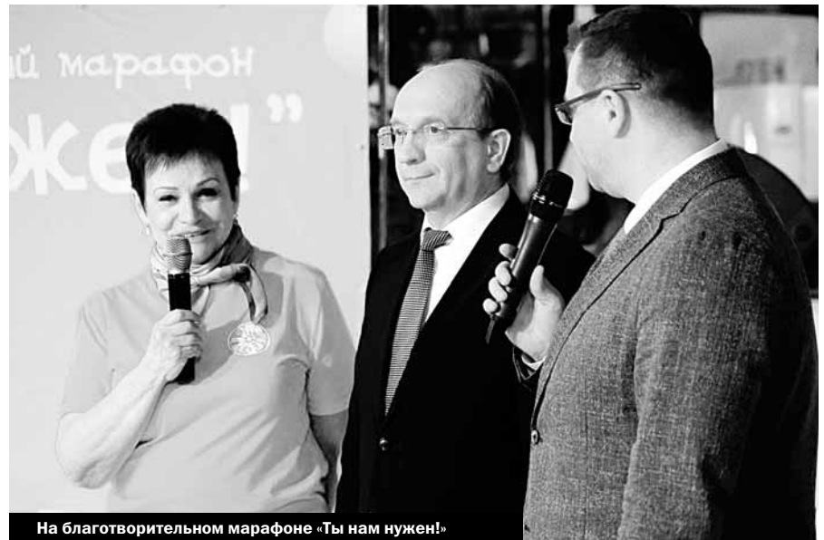
На благотворительном марафоне «Ты нам нужен!»

Среди его целей и задач – содействие развитию предпринимательской деятельности в Иванове, создание условий предпринимательской инициативы среди молодежи, выявление молодых талантов в области инноваций и промышленной деятельности, поиск эффективных бизнес-идей.