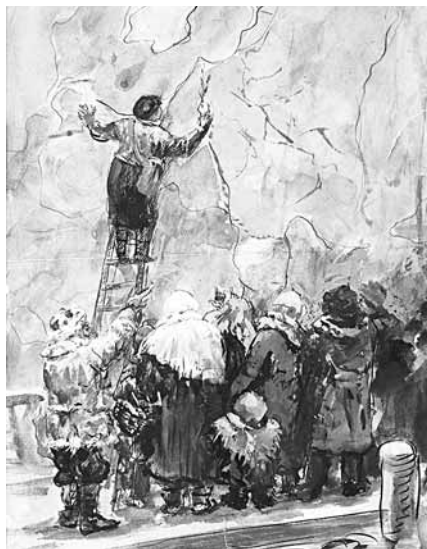
У КАРТЫ. СКОРО ВОЙНЕ КОНЕЦ. 1944 Г. БУМАГА, КАРАНДАШ.

крепости» и «Буревестник», портреты героев произведений писателя.