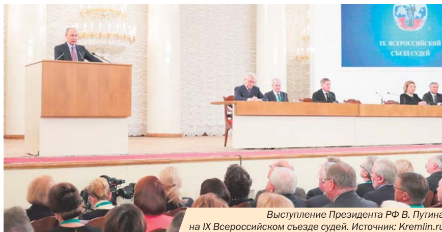
Выступление Президента РФ В. Путина на IX Всероссийском съезде судей.