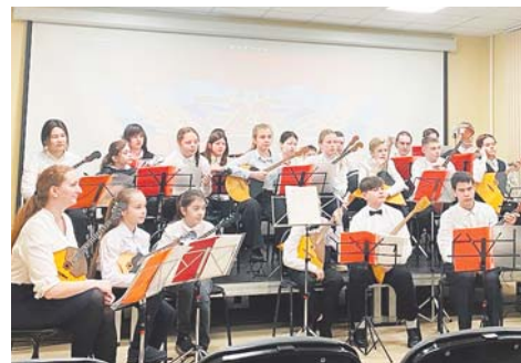
Оркестр русских народных инструментов

— У нас есть традиционные мероприятия. Мы готовим праздничный концерт ко Дню музыки и Дню учителя, он состоится 6 октября. В конце октября мы всегда проводили посвящение в юные музыканты. С изменением статуса школы от этого мероприятия ни в коем случае не будем отказываться и сейчас думаем над изменением названия и концепции. В дальнейших наших планах — концерты ко Дню народного единства, Новому году, Рождеству, 23 февраля и 8 Марта, Пасхе, Дню Победы, наши регулярные четвертные и отчетные концерты и, конечно, выпускной. За каждым мероприятием закреплены свои преподаватели, каждый из них творчески подходит к своей работе, поставленные ими номера каждый раз удивляют новыми идеями.