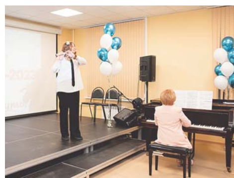
На выпускном — 2023

— В марте 2023 года по инициативе губернатора Станислава Воскресенского был создан Комитет семей воинов Отечества, и мне поступило предложение войти в его состав как матери участника СВО. При Комитете был создан клуб «Дом открытых сердец» для жён, матерей и вдов участников специальной военной операции, и первая встреча клуба прошла у нас в школе. Мы занимаемся организацией мероприятий, которые поддерживают семьи участников СВО, оказывают им психологическую и моральную поддержку, дают почувствовать тепло и неравнодушие человеческих сердец.