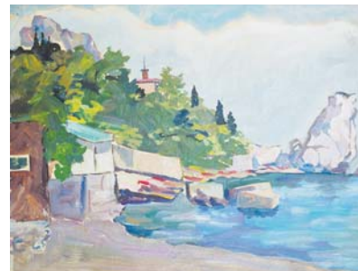
Из серии «Гурзуф». 1971. Картон, темпера. 37 x 48