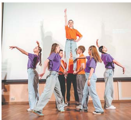
Танец команды «Совенок РЭУ»