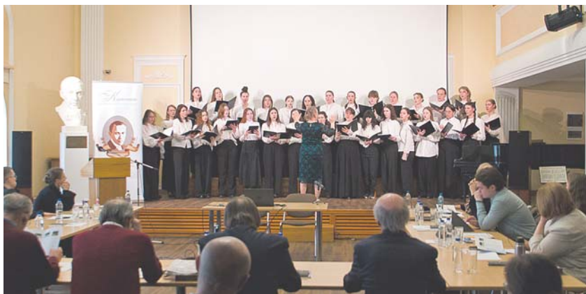
Звучат «Цветы» — пять миниатюр для женских голосов на стихи поэтов Серебряного века

«Весенние воды» прощаются с нами, чтобы встретиться через год на пятом фестивале, когда «Классика» распахнет двери его участникам и гостям. До будущей весны! ТН