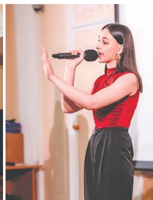
Песня от команды «Эксперты Плюс» была эмоциональной.