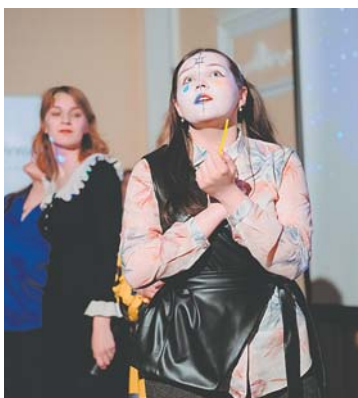
Сценка команды «Flamma» заняла 3-е место

Не успели стихнуть эмоции от зажигательных творческих номеров, как при-