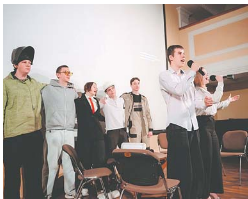
Выступление команды «Строй-старт» принесло ей 2-е место.