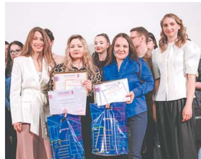
Команда «Flamma» МЮИ — 2-е место в интеллектуальной части конкурса!