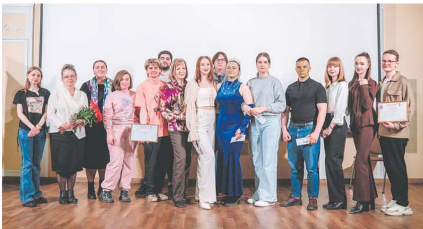
Абсолютный победитель — команда «Фемида» юридического факультета ИвГУ — который год держит планку, занимая 1-е место!

Нам казалось, что такой удачи не бывает: побеждать четыре года подряд.