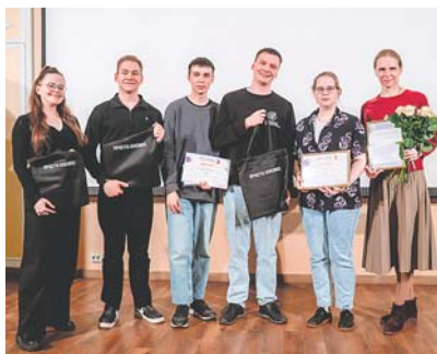
Команда «Экономий» ИвГУТУ

Ну и самый трепетный момент — награждение команд-победителей. Здесь не обошлось без сюрпризов. Впервые 3-е место завоевали сразу четыре команды! Это «Социс», «Экономий», «Строй-старт» и «Президентская академия» из Ивановского филиала РАНХиГС. 2 место заняла команда «Flamma», а победителем конкурса в четвертый раз подряд (!) стала «Фемида». Таким образом, учитывая победу команды в творческой части, юристы ИвГУ стали абсолютными победителями этого года.