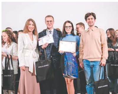
Команда «Президентская академия» РАНХиГС при Президенте РФ

Взрыв эмоций, безудержная радость, удивление — так можно передать состояние героев дня — победителей интеллектуально-творческого состязания длиной почти в целый учебный год. Поздравляли не только ребят, но и их преподавателей, руководителей вузов и факультетов, им были вручены благодарственные письма.