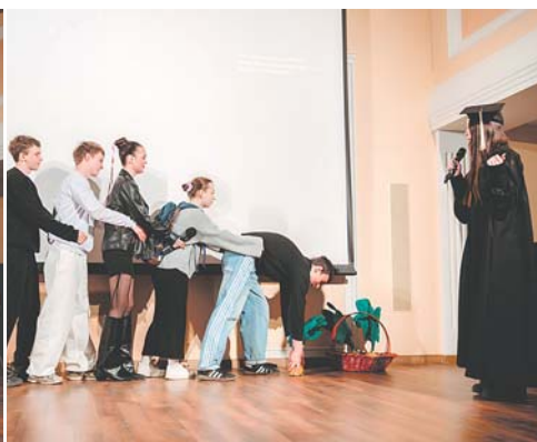
«Юристократы» вытянули не только репку, но и 2-е место!