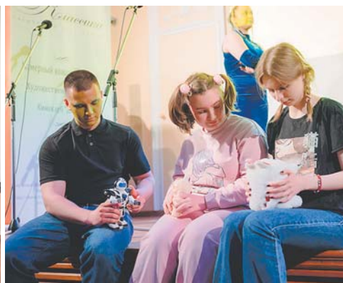
Постановка команды «Фемида» заняла 1-е место!