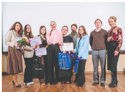
Команда «Социс» Института социально-экономических наук ИвГУ