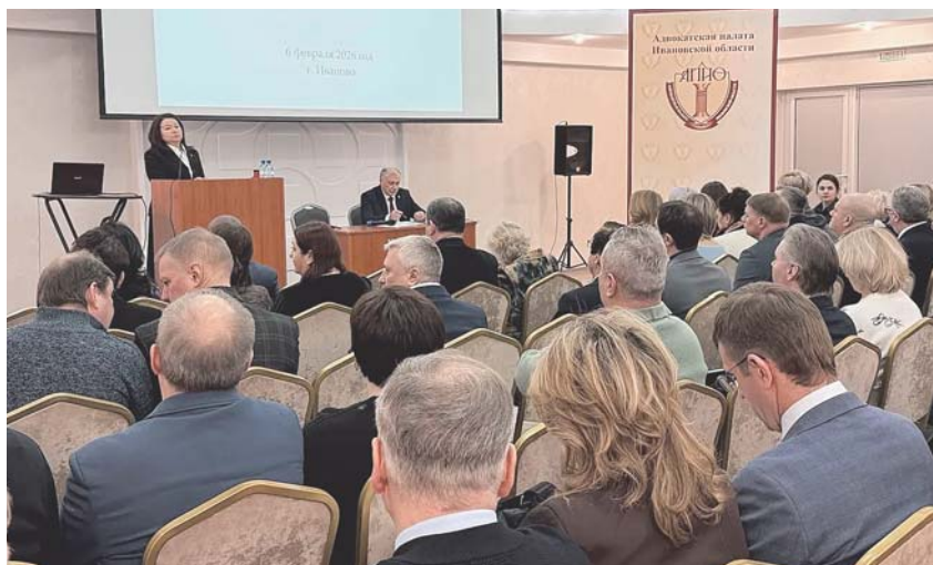
XXV отчетная конференция адвокатов Ивановской области