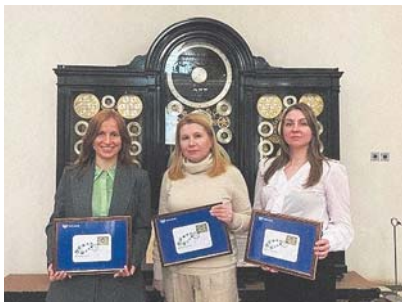
Торжественная церемония гашения марки в Ивановском государственном историко-краеведческом музее имени Д.Г. Бурлыгина

— Туристическая отрасль должна представлять собой систему, комфортную для пользователя: удобство подъезда, перемещения, отдыха, питания и безопасного размещения. Регионы должны демонстрировать туристам не просто привлекательную картинку, а проработанный туристский продукт. Для развития туризма требуется инженерно выстроенная траектория пребывания гостя.