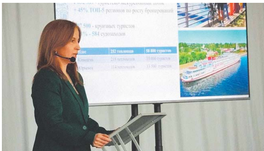
На заседании коллегии Департамента туризма Ивановской области, 2025 год

В советский период регион стал площадкой для демонстрации нового мироустройства: первая фабрика-кухня, крупнейшая концентрация памятников конструктивизма. Наш железнодорожный вокзал строился таким просторным и масштабным неспроста, а с расчётом на статус третьей пролетарской столицы. Сегодня архитекторы со всей стра-